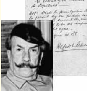
Alfredo L. Palacios, 1880-1965,

«No he admitido nunca la imposición para pensar, para sentir, para querer, y me ha molestado siempre el movimiento isócrono del paso del rebaño. Llevo, en cambio, más tolerancia, que en mi no es escepticismo, porque tengo todavía mucho entusiasmo, que es poderoso propulsor, y porque sigo sintiendo aversión por el prudente de que nos habla Lucrecio, que gozaba viendo desde lo alto de su templo, tranquilo, cómo erraban los hombres por el mar agitado...»